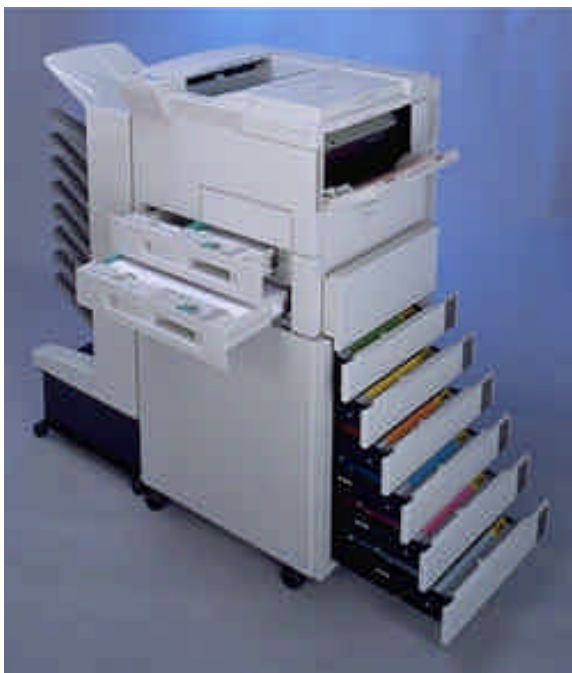
HP LaserJet 8100 mit TowerFeed Option und Ausgabe-Einheit

Anstatt zum Kopierer zu gehen, drucken Sie sich die Kopien doch gleichzeitig mit dem Originaldokument aus. Sie sparen sich nicht nur den Weg zum Kopierer, Sie erhalten die bessere Qualität mit perfekten Grautönen. Dass diese Kopien zudem noch billiger sind, ist ein ganz willkommener Nebeneffekt.